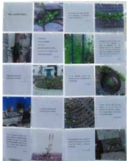
Des citations de scientifiques, écrivains ou poètes, regroupées en orientations thématiques (4 “rideaux”).