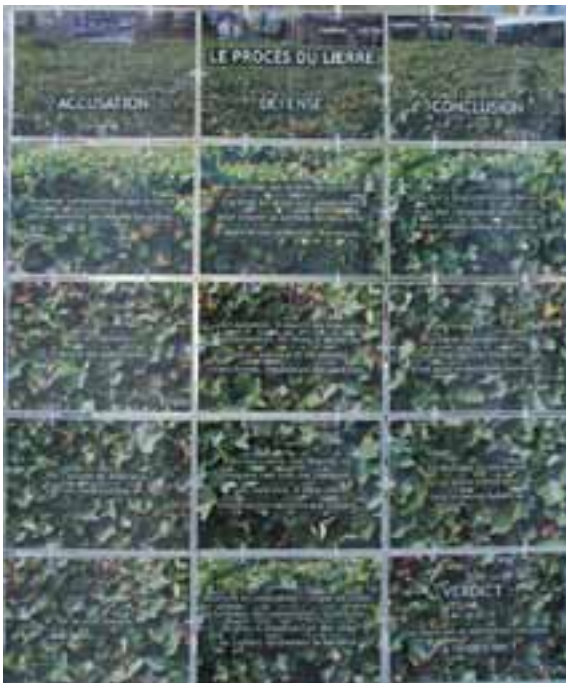
“Le procès du lierre” (pour déjouer les idées reçues sur ce mal-aimé).