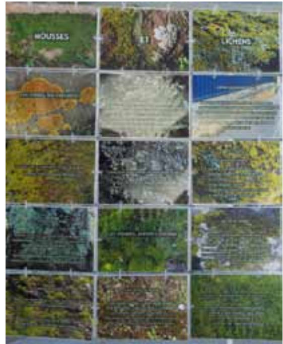
“Mousses et lichens” (premiers terreaux et rôle de bioindication).