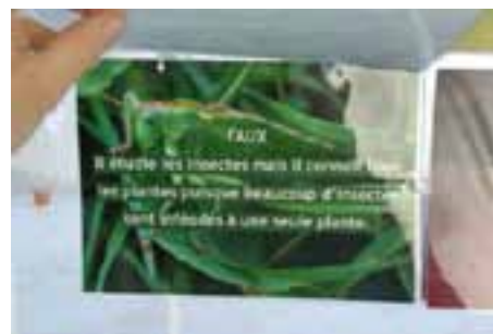
C'est le seul “rideau” double : en soulevant les questions, on peut lire les réponses.