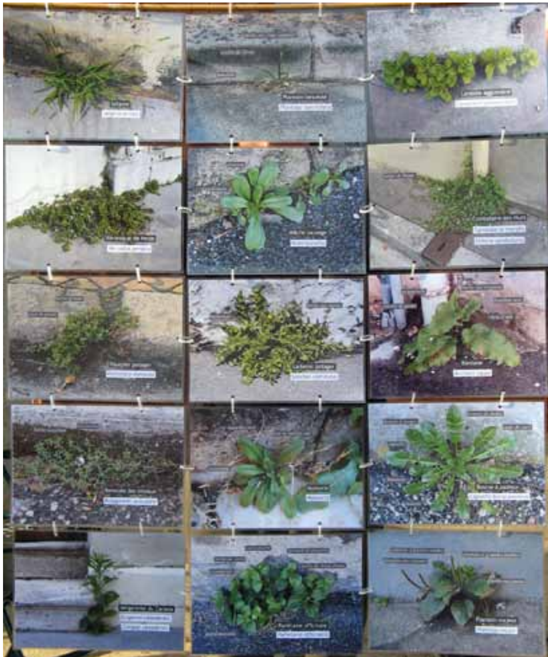
Un “Herbier urbain” montrant une soixantaine d’exemples de plantes sauvages des rues, avec leur nom savant, leur nom commun et leurs nombreux noms populaires. (4 “rideaux”).