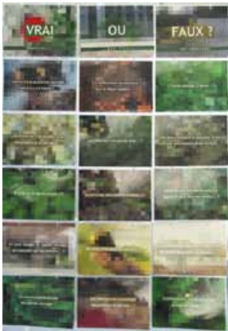
Le jeu “Vrai ou Faux ?” pour tous les âges. 15 questions se rapportent au contenu de l'exposition.