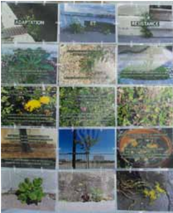
“Adaptation et résistance” (les conditions de croissance des végétaux).