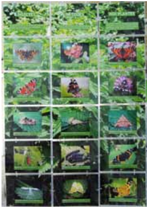
“Insectes inféodés aux plantes” (l'exemple des pensionnaires de l'ortie).