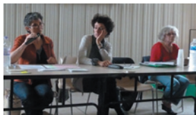
Réunion publique organisée par le collectif ariègeois

Au tout début de l'infection les symptômes précoces peuvent être complètement absents ou se superposer à une symptomatologie plus tardive, ou une autre pathologie. Le fait de contracter la maladie une première fois ne prémunit en rien l'organisme humain. Le plus caractéristique des signes est un érythème migrant, plaque rouge qui apparaît souvent 1 à 3 semaines après la piqûre. Dans de nombreux cas, 7 à 10 jours après la piqûre se présente un épisode grippal avec douleurs musculaires, fièvre, céphalée et fatigue. L'érythème ainsi que l'épisode grippal disparaissent après quelques jours ou quelques semaines. Et pourtant, ce germe microbien peut s'activer longtemps après, des mois, voire des années plus tard, à la faveur d'un stress, d'une autre infection ou de toute autre cause ; et si la réponse immunitaire est moins performante, il peut déclencher des symptômes avec atteinte générale qui se chronicisent en l'absence d'intervention. Les symptômes typiques du stade avancé de l'infection sont la paralysie faciale, l'arthrite (souvent unilatérale), la cardite, les névralgies et névrites crâniennes et dans la