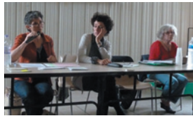
Réunion publique organisée par le collectif ariègeois

Au tout début de l'infection les symptômes précoces peuvent être complètement absents ou se superposer à une symptomatologie plus tardive, ou une autre pathologie. Le fait de contracter la maladie une première fois ne prémunit en rien l'organisme humain. Le plus caractéristique des signes est un érythème migrant, plaque rouge qui apparaît souvent 1 à 3 semaines après la piqûre. Dans de nombreux cas, 7 à 10 jours après la piqûre se présente un épisode grippal avec douleurs musculaires, fièvre, céphalée et fatigue. L'érythème ainsi que l'épisode grippal disparaissent après quelques jours ou quelques semaines. Et pourtant, ce germe microbien peut s'activer longtemps après, des mois, voire des années plus tard, à la faveur d'un stress, d'une autre infection ou de toute autre cause ; et si la réponse immunitaire est moins performante, il peut déclencher des symptômes avec atteinte générale qui se chronicisent en l'absence d'intervention. Les symptômes typiques du stade avancé de l'infection sont la paralysie faciale, l'arthrite (souvent unilatérale), la cardite, les névralgies et névrites crâniennes et dans la