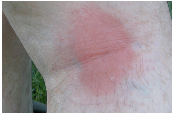
▼ Ancienne piqûre de tique

la prise d'antibiotique s'impose. En phase tardive, la symptomatologie va décider du choix des médicaments à administrer, de la forme des prises et de la longueur du traitement. Il s'agit le plus souvent d'une céphalosporine de 3ème génération pour 2 à 4 semaines, par perfusion journalière en hôpital. La chronicité n'étant pas admise, au-delà de ces 28 jours réglementaires le patient serait guéri. Suivant les tenants du Consensus officiel, tout autre traitement sur la durée serait de toute façon infondé. En clair, si la borréliose en première phase est généralement facile à soigner, la borréliose de Lyme chronique est une maladie non traitée par la médecine universitaire qui oriente les patients vers des solutions psychosomatiques. La réponse thérapeutique sérieuse ne peut donc s'envisager que hors cadre et le traitement ne peut être qu'individualisé et sur le long terme. Les médecins qui s'y investissent sont très peu nombreux. Le désert médical est une réalité cruelle pour les malades. La recherche scientifique est une condition sine qua non pour affronter cette pathologie polymorphe complexe très difficile à cerner et c'est l'Etat qui doit prendre ses responsabilités et s'engager de toute urgence.