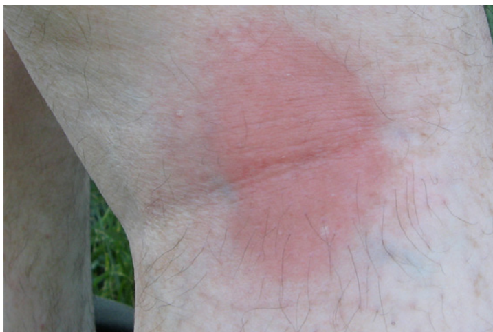
▼ Ancienne piqûre de tique

Si dans le cas d'une primo-infection l'antibiothérapie reste la bonne pratique pour stopper la borréliose, officiellement il n'y a pas de traitements pour le malade chronique en France... la maladie n'existant pas ! Pour mémoire, c'est bien cette "non-assistance à personnes en danger",